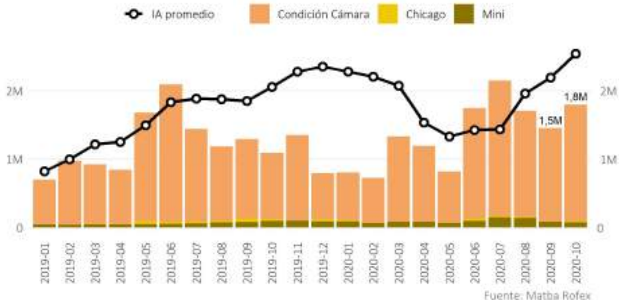
Volumen Total Operado por mes de Futuros y Opciones de Maíz En toneladas

El volumen de futuros y opciones de Maíz alcanzó 1,8 millones de toneladas, un 65,3% superior interanual. Por su parte, el IA promedio de todos los productos de Maíz aumentó 23,6% i.a., promediando 2,5 millones de toneladas y alcanzando un récord histórico .