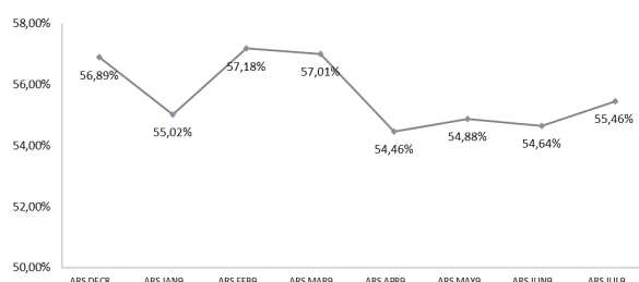
Tasa Implícita Dólar Rofex